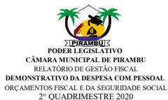
Tabela 1 - Demonstrativo da Despesa com Pessoal - Estados, DF, Municípios RGF - ANEXO 1 (LRF, art. 55, inciso I, alínea "a")