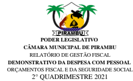
Tabela 1 - Demonstrativo da Despesa com Pessoal - Estados, DF, Municípios RGF - ANEXO I (LRF, art. 55, inciso I, alínea "a")