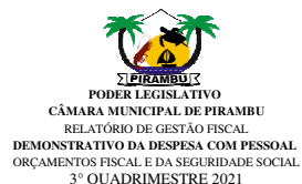
Tabela 1 - Demonstrativo da Despesa com Pessoal - Estados, DF, Municípios RGF - ANEXO 1 (LRF, art. 55, inciso I, alínea "a")