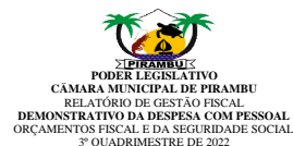
Tabela 1 - Demonstrativo da Despesa com Pessoal - Estados, DF e Municípios RGF - ANEXO I (LRF, art. 55, inciso I, alínea "a")